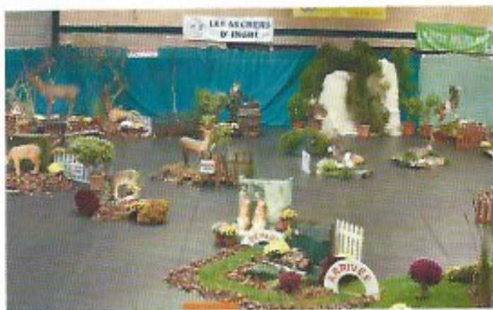
Une mise en scène toujours aussi inventive

Fort des expériences de 2012 et 2014, les Archers d'Ingré ont décidé de repartir pour une nouvelle mise en place d'un 3D Indoor en 2017. La question qui se posait était de faire différent et encore mieux que les éditions précédentes. Mais comment organiser un concours amical 3D encore un peu plus innovant que les fois précédentes ? C'est là que l'esprit créatif de quelques inconditionnels de l'événement a joué, et l'idée a fait son chemin : pourquoi ne pas envisager de passer d'un concours de 20 cibles à un concours de 40 cibles ? Notre gros avantage réside dans le fait de pouvoir disposer, grâce à l'aide de la municipalité d'Ingré, d'un gymnase suffisamment vaste pour que nos 40 cibles puissent être positionnées de façon idéale, tout en respectant des distances équivalentes aux concours extérieurs. Cela suppose de les tirer dans tous les axes, en étudiant de façon précise les différentes trajectoires. Il va falloir étudier toutes les situations de tir, depuis les cibles tirées au sol, celles qui seront tirées à partir d'éléments surélevés, et celles qui le seront à partir des miradors (deux miradors