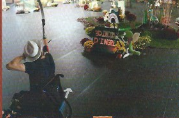
Les archers handisport avaient été invités et étaient présents

différents supports et des cibles directement au bon endroit. Parallèlement, une équipe met en place les différentes protections (filets, stramits en fond de salle, ...). Place aux éclairages puisque chacune des cibles sera éclairée individuellement au moyen de spots à led. Merci au magasin Leroy Merlin d'Ingré qui a eu la gentillesse de nous aider avec la mise à disposition de spots. Et puis, la touche finale le vendredi, avec la livraison et la mise en place des différents éléments